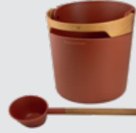
Helmi stävä and scoop pişmiş toprak, SA011R