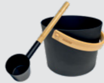
Stävä ayrıca kepçeyle de toplanıyor. SAC10111