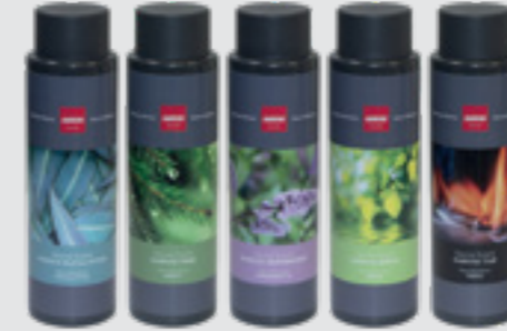
Sauna kokuları 400 ml Okaliptüs SAC25021, Çam SAC25023, Nane SAC25024, Huş ağacı SAC25022, Tar SAC25025