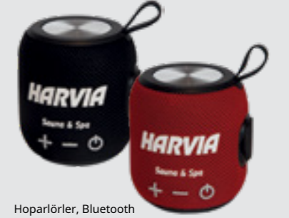
Hoparlörler, Bluetooth SAC80501, siyah SAC80500, kırmızı