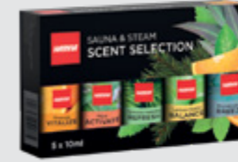
Sauna ve buhar odası koku seti 5x10ml, SAC25100