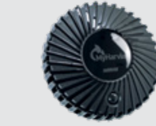
MyHarvia Akıllı Sauna Sensörü WiFi SAM001W