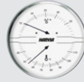
Termometre ve higrometre beyaz, Ø 160 mm SAC90210