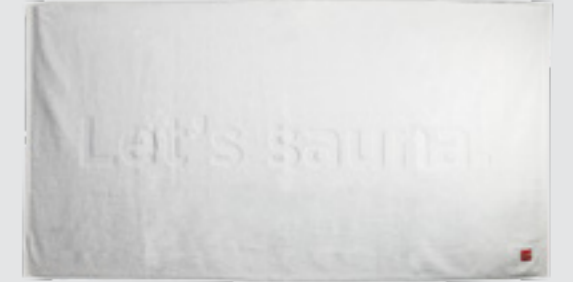
Harvia Let's sauna havlusu, 90x170 cm SAC80403