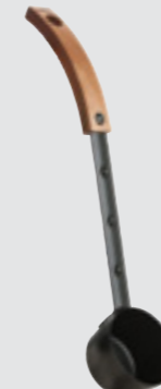
Efsanevi kova SASPO101