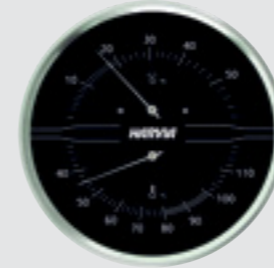
Termometre ve higrometre siyah, Ø 160 mm SAC90210