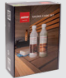
Sauna bakım paketi SAC25070