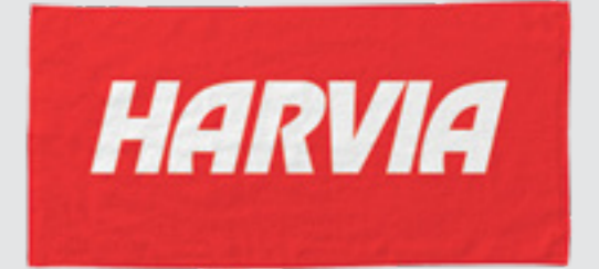
Harvia logolu havlu 70x140 cm, SAC80401 35x55 cm, SAC80402