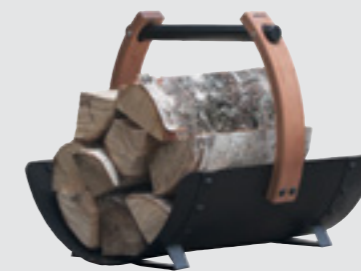
Efsanevi odun sepeti SASPO102