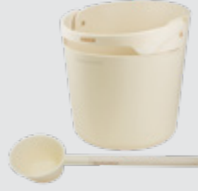
Helmi stävä and scoop beyaz, SA011V