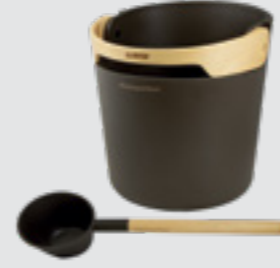
Helmi stävä and scoop çikolata, SA011B