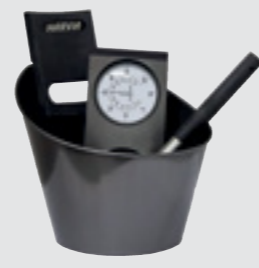
Sauna ürün paketi siyah çelik, SA007