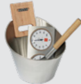
Sauna ürün paketi çelik, SA006