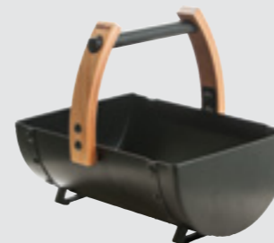
Efsanevi yay SASPO100