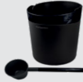
Helmi stävä and scoop siyah, SA011M